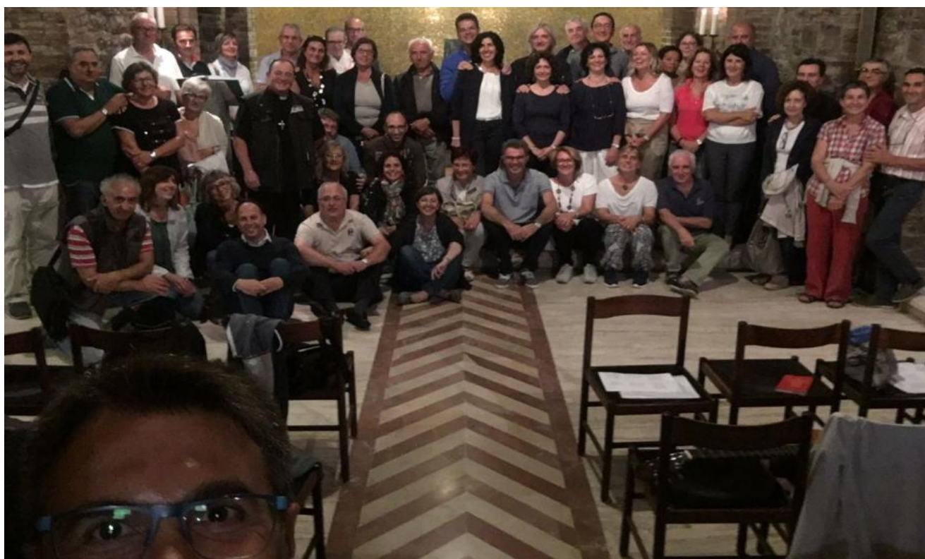
Le coppie di Responsabili di Settore dal 2013 in poi

Ovvero...verso la scelta della nuova coppia di Responsabili Regionali